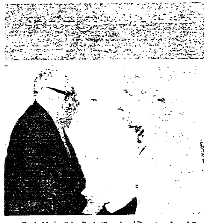
الرئيس شمعون يستقبل سفير الاتحاد السوياتي في لبنان السيد الكسندر سولدايوف

وقال النائب الجليل الرئيس شمعون ان بعض أعضاء الأحزاب اليسارية في بغربين يستفزون الاهالي ، وخاصة أعضاء حزب الكتائب ، ويقومون بقطع الطرق واقامة الحواجز ، واطلاق الرصاص في الهواء اربابا ، فصدر الرئيس شمعون اوامره بتعزيز قوات الأمن في المنطقة ومنع المظاهرات العارفة .